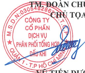
VŨ TIỀN DƯƠNG